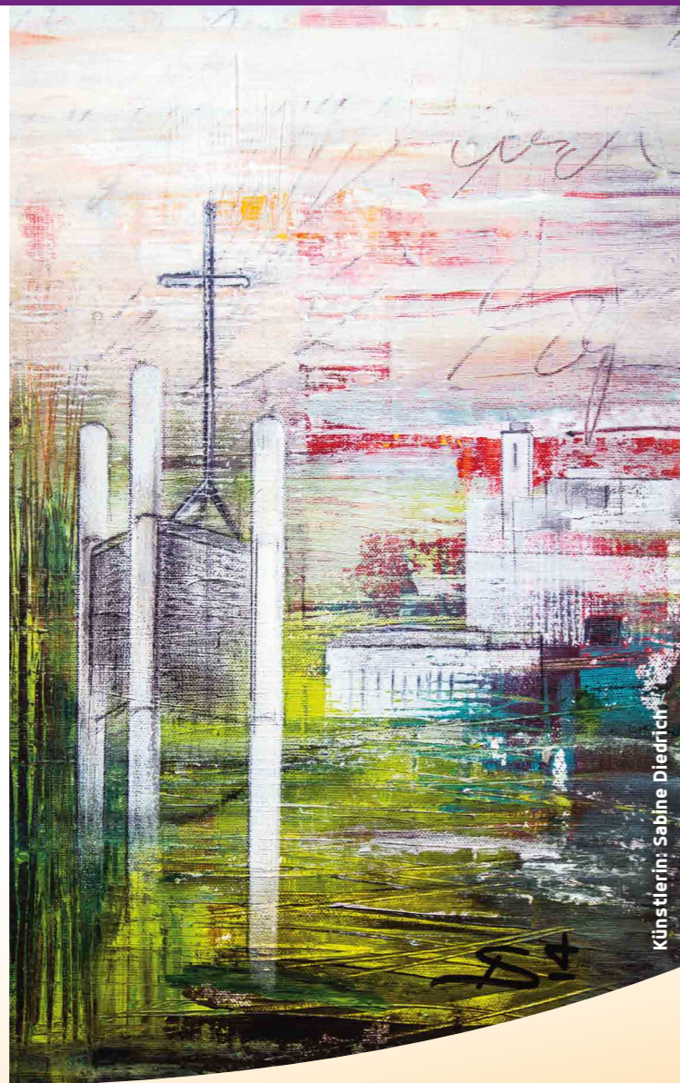
Künstlerin: Sabine Diedrich

MITEINANDER (ER) LEBEN – FÜREINANDER DA SEIN